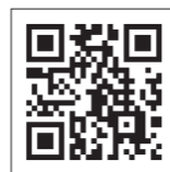
新協ホームページ